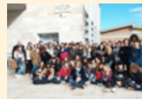
échange avec Sienne

L'EsaBac est ouvert à tous les élèves de l'académie et n'est soumis à aucune sectorisation. Le lycée Choiseul dispose d'un internat fille et garçon. La rénovation récente (2016) permet aux élèves d'y étudier et d'y vivre dans de bonnes conditions.