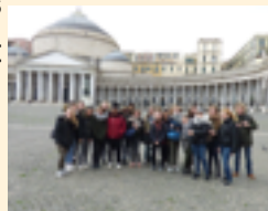
échange avec Meta di Sorrento

Les programmes d'histoire et de langue et littérature sont fixés conjointement par la France et l'Italie. Celui de géographie est conforme au programme national en vigueur.