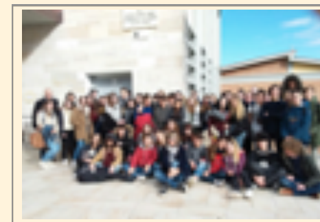
échange avec Sienne

L'EsaBac est ouvert à tous les élèves de l'académie et n'est soumis à aucune sectorisation. Le lycée Choiseul dispose d'un internat fille et garçon. La rénovation récente (2016) permet aux élèves d'y étudier et d'y vivre dans de bonnes conditions.